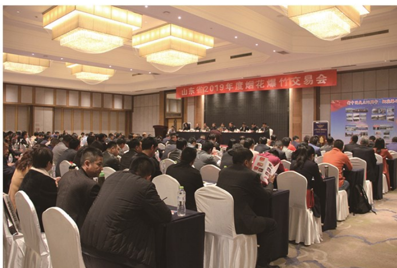
◁ 交易会开幕式现场