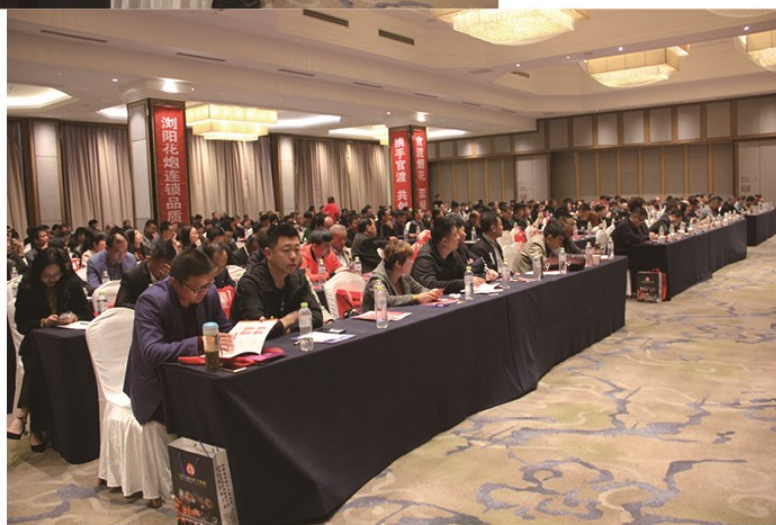
▷ 交易会开幕式现场

4月8日—10日，山东省2019年度烟花爆竹交易会在泰安市宝盛大酒店成功举办。省公安厅、省应急管理厅、省供销社、泰安市政府、市供销社和烟花爆竹主产区政府领导应邀参会，与省内、外烟花爆竹企业代表、商会代表齐聚泰山脚下，共襄交易盛会。